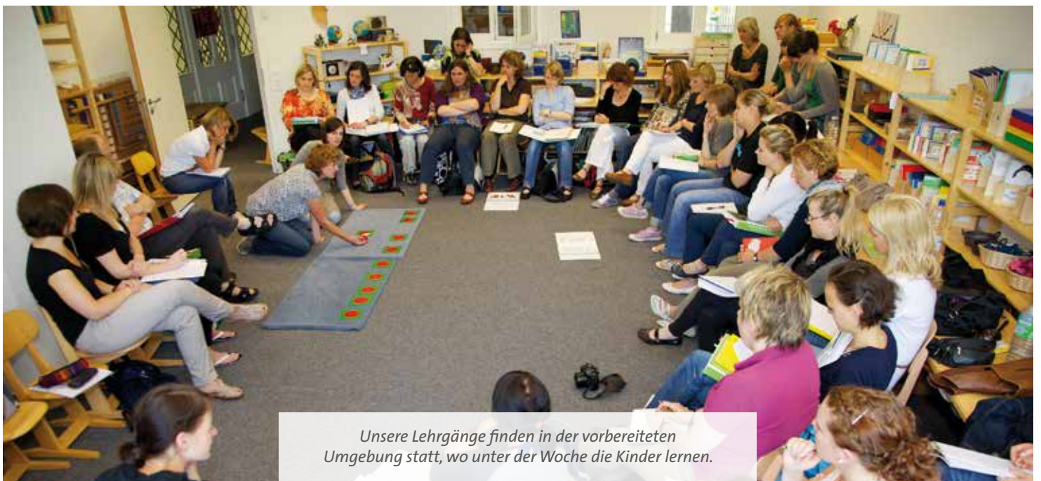
Unsere Lehrgänge finden in der vorbereiteten Umgebung statt, wo unter der Woche die Kinder lernen.