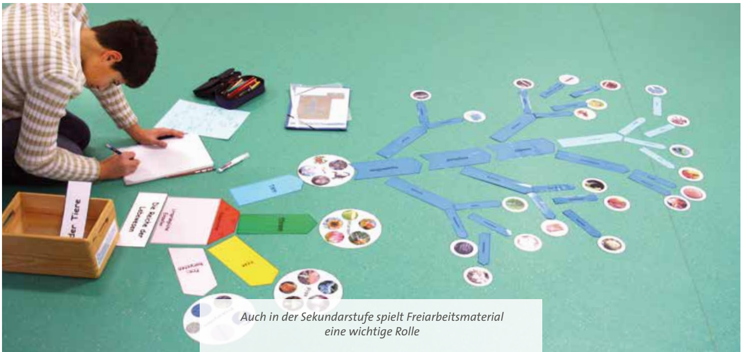
Auch in der Sekundarstufe spielt Freiarbeitsmaterial eine wichtige Rolle