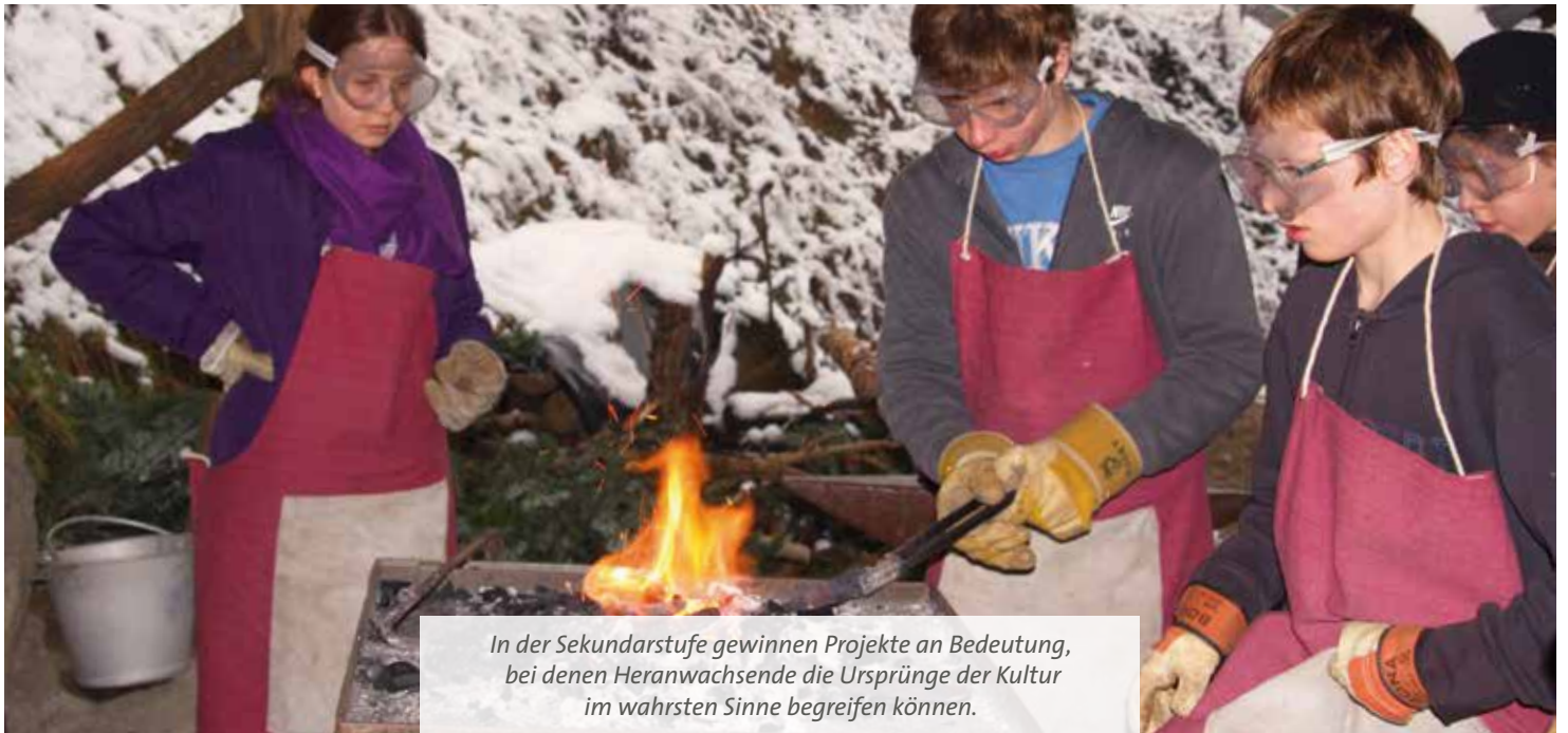
In der Sekundarstufe gewinnen Projekte an Bedeutung, bei denen Heranwachsende die Ursprünge der Kultur im wahrsten Sinne begreifen können.